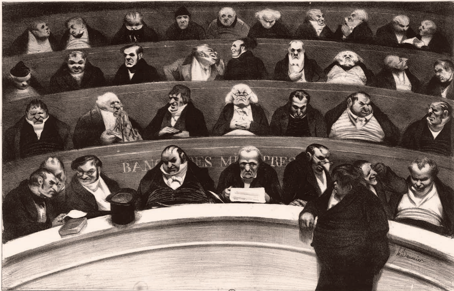
LE VENTRE LÉGALITIF. Aspect des bancs ministériels de la chambre improvisée de 1834.

18 e Dessin de L'Association mensuelle (mois de Janvier)